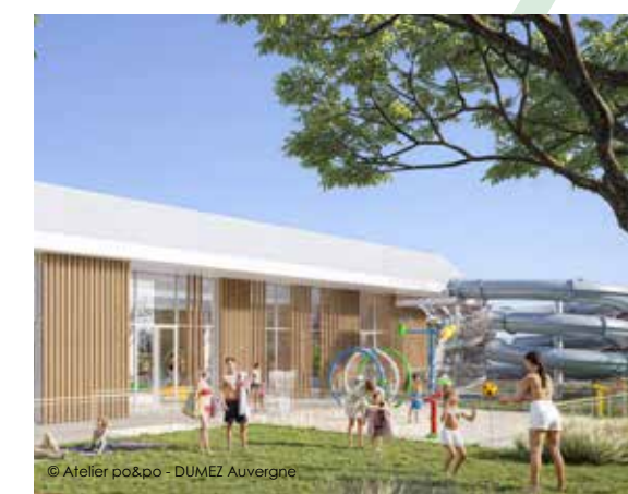
© Atelier po&po - DUMEZ AUVERGNE