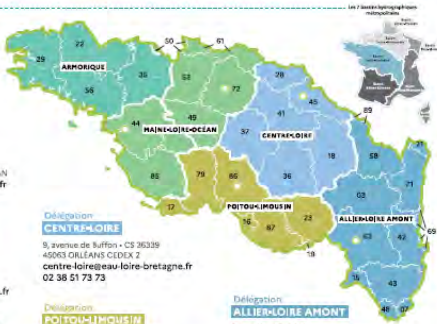
Les 7 bassins hydrographiques métropolitains

Site de Marmillat Sud 19, allées des eaux et forêts + CS 40039 63370 LEMPODES allier-loire-amont@eau-loire-bretagne.fr 04 73 17 07 10