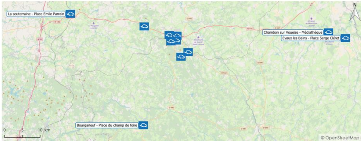
Emplacement des bornes de recharge pour véhicules électriques (département)