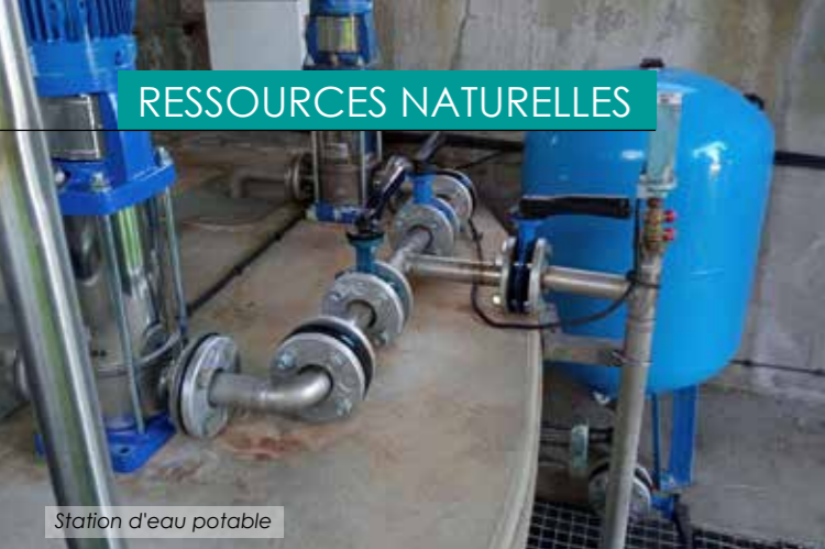
Station d'eau potable