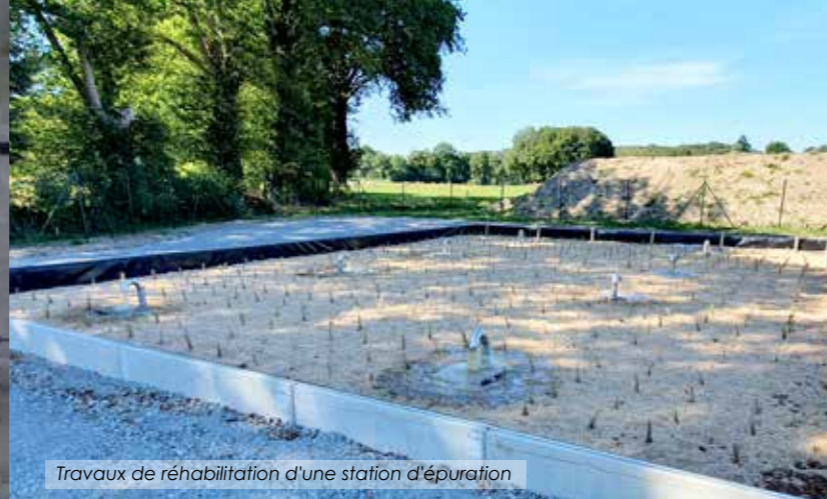
Travaux de réhabilitation d'une station d'épuration