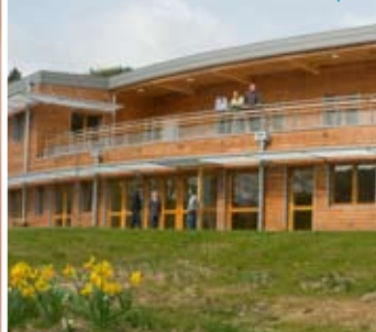
Centre de Ressources Domotique